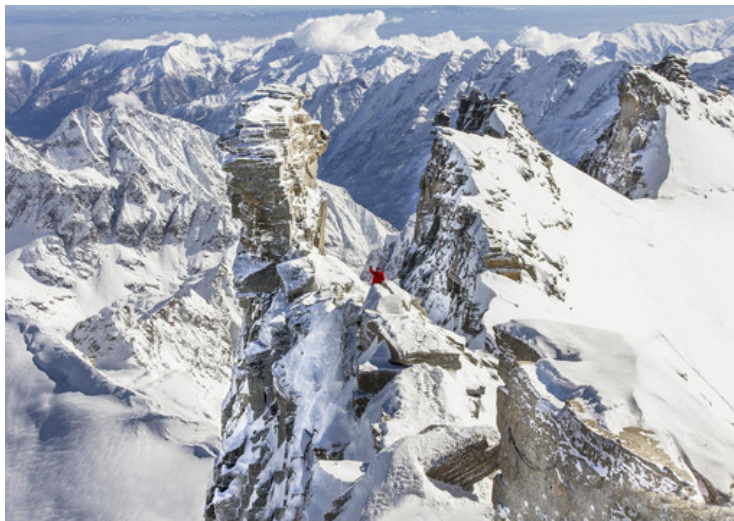
Cima del Gran Pardiso

Un percorso che porterà un gruppo di dodici ragazzi e ragazze a vivere l'ascesa di tre grandi cime del Gran Paradiso